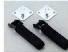
固定プレート・固定ベルト 付き。 ※固定プレート用ネジは 別途ご用意ください。