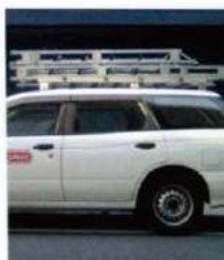
車載ラクラクなコンパ クト設計