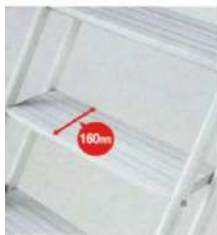
ステップ幅が広いラク ラク安心設計